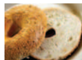
Bagel al sesamo