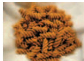
Bisli a forma di fusilli