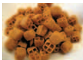
Bisli a volontà