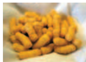
L'eterna tentazione Bamba

ore al giorno e non è raro vedere alle ore più strampalate famiglie e giovani carichi di bagagli che non rinunciano alla soddisfazione di ingurgitare un mitico Big Mac kosher. Anche perché per trovare un altro McDonald's kosher bisogna fare parecchia strada: l'unico locale kosher della McDonald's fuori da Israele è a migliaia di